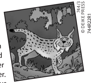
74473 744R2R1

Der Luchs trägt an seinen Ohren auffällig lange Haare, sie werden auch als Pinsel bezeichnet. Diese etwa vier Zentimeter langen Büschel sind ein Trick der Natur, denn durch diese kann die Wildkatze noch besser hören: Die feinen Haare leiten nämlich Geräusche ins Ohrinnere weiter. Sie wirken also fast wie Antennen. Deshalb weiß der Luchs schnell, aus welcher Richtung ein Geräusch kommt. Eine Maus hört er beispielsweise noch aus 65 Metern Entfernung rascheln, außerdem kann er verschiedene Geräusche unterscheiden, die mehrere hundert Meter weit weg entstehen. Von allen Landtieren hört der Luchs am besten!