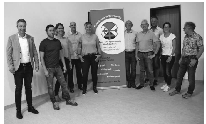
TSV Vorstand 2021