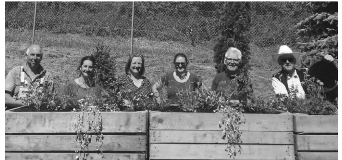
Die Vereine OGV Schweinhausen und LQ Hochdorf haben Kisten fürs Kreismusikfest bepflanzt

An allen Ecken ist in Hochdorf das Kreismusikfest zu spüren. Musik.Zusammen.Erleben - ab 15. Juni ist es soweit. Auch die anderen Vereine sind aktiv und leisten einen Beitrag. Der Obst- und Gartenbauverein und der Verein Lebensqualität haben Holzkisten mit blühenden Sommerblumen bepflanzt um die Ortseingänge zu verschönern. Herzlichen Dank an die fleißigen Helferinnen und Helfer und an den Bauhof, der das Material und den Platz zur Verfügung gestellt hat. Wir freuen uns auf das Kreismusikfest.