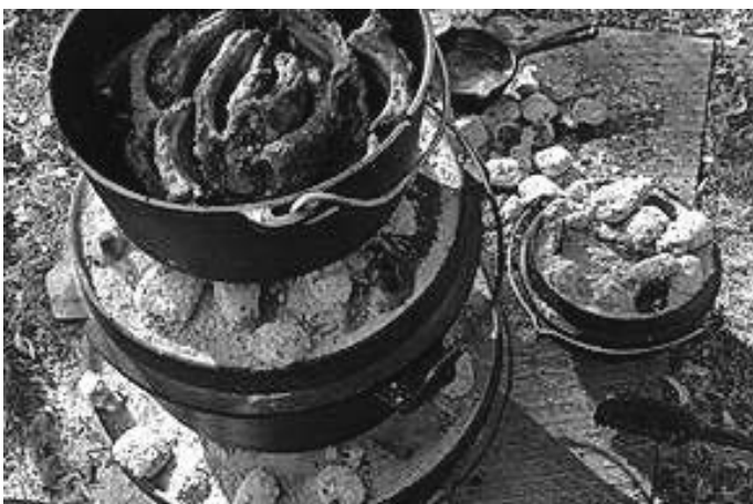
Dutch Oven - Foto Mandy Hopp

Genauere Information erhältst Du nach der Anmeldung.