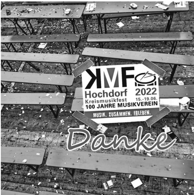
von Klaus Christ