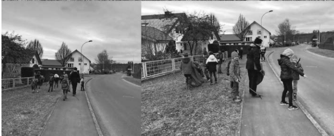
Fleißige Kid's werden mit einem Schatz belohnt