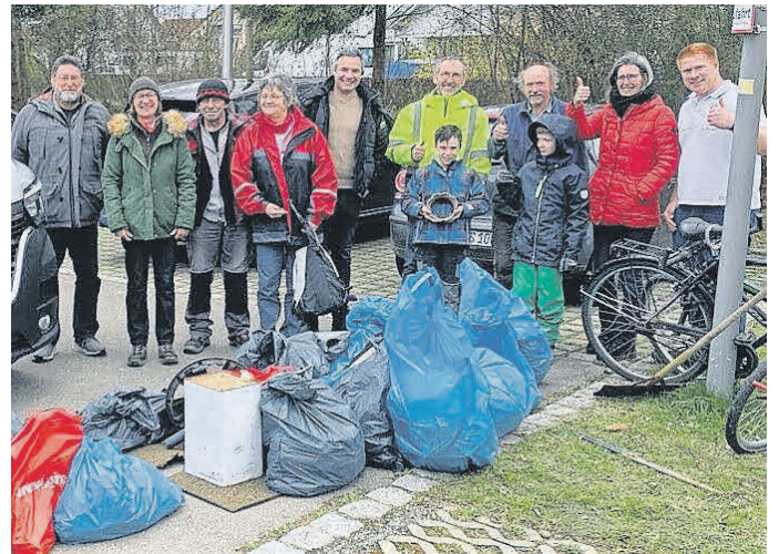
Da kommt was zusammen, Abschlussfoto der Sammlung 2022.

Um besser planen zu können, bitten wir um eine Anmeldung bis Samstag, 19. März 2023 unter nicole.schwarzkopf@ingoldingen.de bzw. r.link@gemeinde-hochdorf.de . Mehr Infos unter www.muellsammelaktion.de