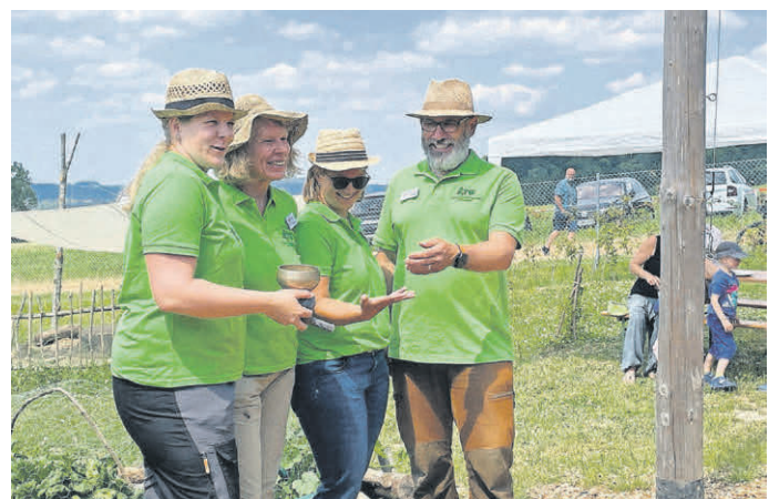
Team des Hochdorfer Waldkindergartens.