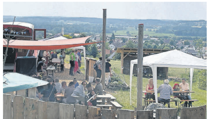
Tag der offenen Tür

Der Tag der offenen Tür im Waldkindergarten Hochdorf war ein voller Erfolg und hat sowohl den Besuchern als auch dem Team des Kindergartens wertvolle Einblicke ermöglicht. Eltern, die Interesse an einem Kita-Platz im Waldkindergarten haben, wurden ermutigt, sich für weitere Informationen direkt an das Team des Kindergartens oder an die Gemeindeverwaltung Hochdorf zu wenden.