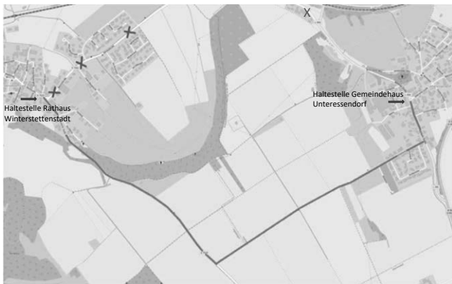
Linienführung Linie 217 während der Baumaßnahmen.

Die Haltestellen Winterstettenstadt Ränkle und Unteressendorf Bahnhof können während der Baumaßnahme nicht bedient werden. Fahrgäste werden gebeten, stattdessen die Haltestellen Winterstettenstadt Rathaus bzw. Unteressendorf Gemeindehaus zu nutzen.