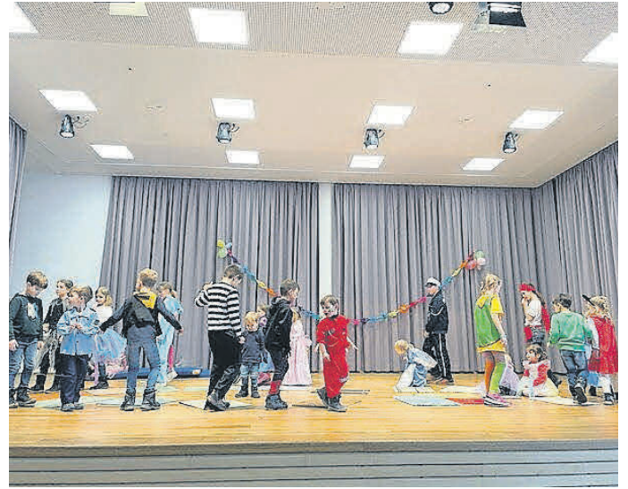
Elternbeirat KiGa Zwergenstube

Es war ein toller Nachmittag mit einem bunten Umzug bei strahlendem Sonnenschein und viel Spaß in der Gemeindehalle. Herzlichen Dank auch an dieser Stelle der freiwilligen Feuerwehr Hochdorf, die uns den Weg bei Umzügen frei hält und dem Musikverein Hochdorf für die musikalische Begleitung!