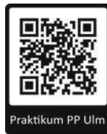
Praktikum PP Ulm