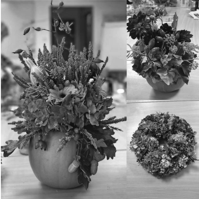
Beispiele aus früheren Workshops

Dann melde DICH bei uns bis zum 10. September 2024 an unter 0173/8809831 oder kontakt@ogv-schweinhausen.de Die Teilnehmerzahl ist begrenzt auf 12 Personen.