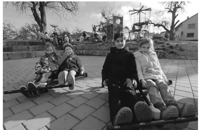
Die neuen Doppel-Racer machen sind der Renner.

Ihre Kinder der Rosenbach-Grundschule Hochdorf