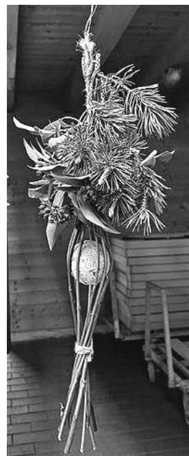
Die Kinder bastelten einen Halter für Meisenknödel

Die Augen waren groß bei den Leuten, die das Bahnwärterhäuschen noch als JuZe kennen. Sie staunten nicht schlecht, was der Verein mit